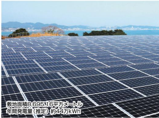
敷地面積8,695.16平方メートル 年間発電量(推定)約44万kWh

民間事業者が設置する太陽光発電設備を区が「再生可能エネルギーの固定価格買取制度」の期間内である20年間賃借し、区が事業主体として発電を行います。